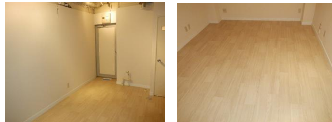
写真はイメージになります