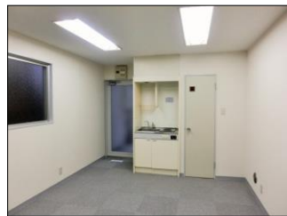
写真はイメージになります