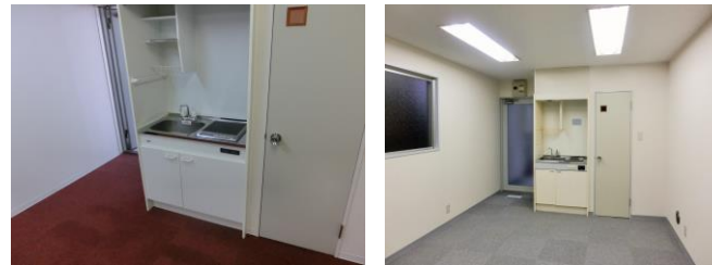
写真は当ビル4階 イメージになります